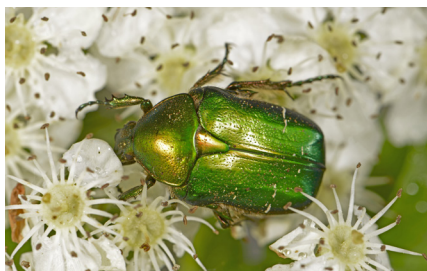
Gemeiner Rosenkäfer Cetonia aurata