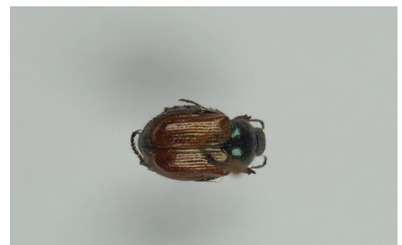
Gartenlaubkäfer Phyllopertha horticola