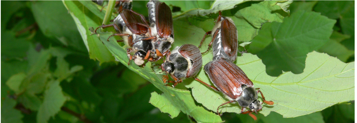
Abb. 1: Käfer des Feldmaikäfers