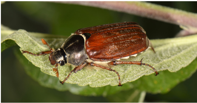
Feldmaikäfer Melolontha melolontha