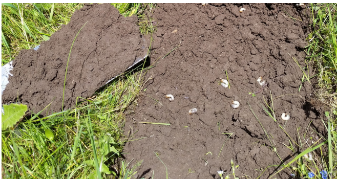
Abb. 2: Fraßschäden an der Grasnarbe durch Engerlinge

Bedeutsamer ist der Schaden durch Wurzelfraß der Engerlinge. Dieser kann an den Pflanzen schon im Flugjahr sichtbar werden, in Obstkulturen aber meistens erst in darauffolgenden Jahren. Die Schäden bestehen in nesterweise nachlassendem Wuchs, Kleinfrüchtigkeit von Obst bis hin zu Totalausfall. Das kann in Trockenjahren existenzgefährdend sein. Die Fraßaktivität der Engerlinge an der Grasnarbe führt zu abgestorbenen Rasenpartien; braune Nester im Rasen sind die Folge.