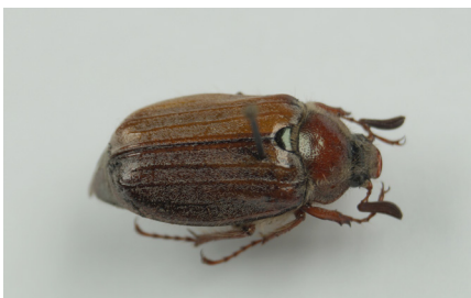
Waldmaikäfer Melolontha hippocastani