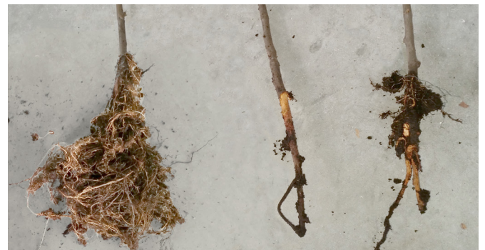
Abb. 3: Fraßschäden im Wurzelbereich durch Engerlinge

Vier bis sechs Wochen nach der Eiablage schlüpfen die Larven, die Engerlinge. Im ersten Larvenstadium (L 1) breiten sie sich kaum aus; Fraßschäden treten nicht auf. Nach sechs Wochen häuten sich die Tiere zum zweiten Larvenstadium (L 2). Jetzt wandern sie einem Kohlendioxid-Gradienten folgend in Richtung Bodenoberfläche. Hier ernähren sie sich von Wurzeln aller Pflanzenarten, anfangs bevorzugt von Gräsern. Bei starker Trockenheit, spätestens im Spätherbst, graben sich die Engerlinge in frostfreie Bodenschichten vor und überwintern in