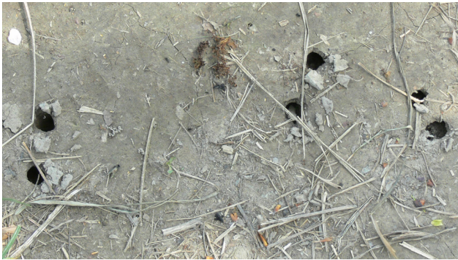
Abb. 4: Ausbohrlöcher adulter Feldmaikäfer

0,50–1,50 m Tiefe. Im zeitigen Frühjahr arbeiten sie sich wieder zu den Wurzeln vor. Im Sommer findet die zweite Häutung zum dritten Larvenstadium (L 3) statt. Besonders in diesem Stadium verursacht der Engerling starke Wurzelschäden (Abb. 3), bevor er sich nach einer nochmaligen Überwinterung zur Zeit der Heuernte in einer Bodentiefe von 30–40 cm verpuppt. Ein bis zwei Monate danach verlässt der Käfer die Puppe, verbleibt aber bis zum kommenden Frühjahr im Boden.