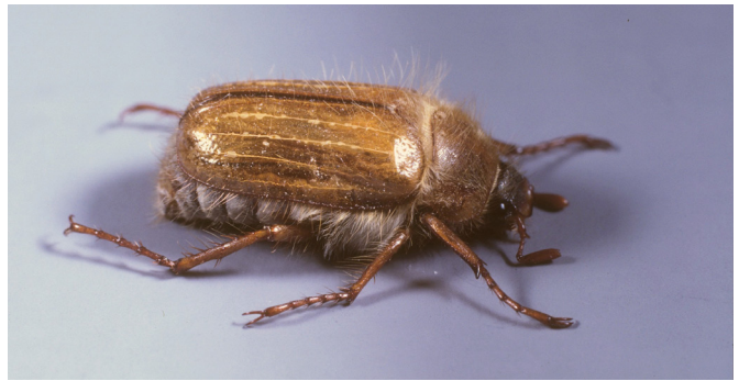
Junikäfer Amphimallon solstitiale